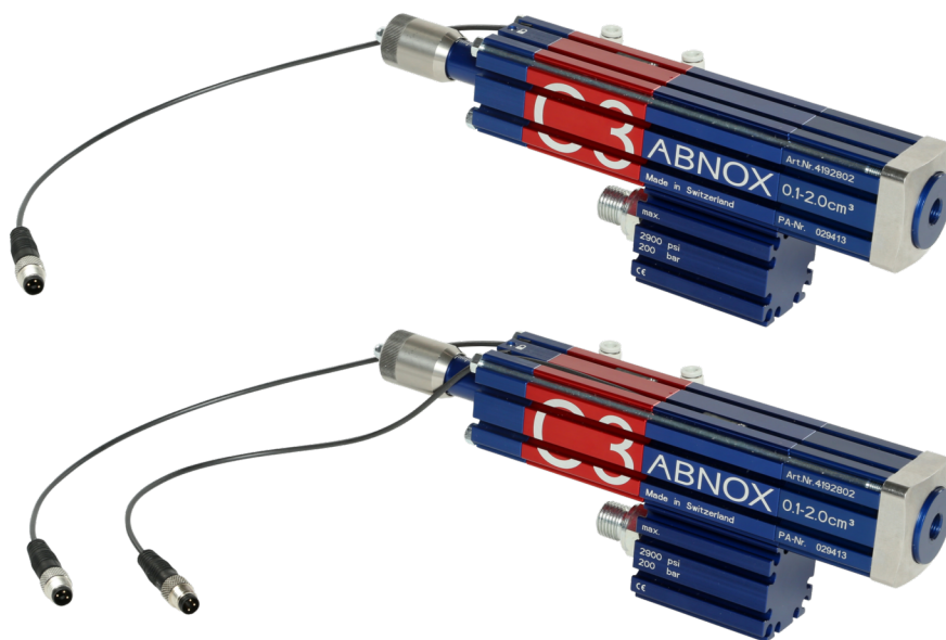
AXDV-C mit 1 Sensor und 2 Sensoren

Die als Zubehör erhältlichen Magnetfeld-Sensoren (Art-Nr. 0001220) der Kolbenabfrage können mittels einer Befestigungsschraube stufenlos in den vorhandenen Nuten geschützt positioniert werden. Die Betriebsanzeige (LED) signalisiert zusätzlich optisch die Endpositionen des Fettkolbens. Für eine hohe Prozesssicherheit empfiehlt ABNOX den Einsatz einer Zweifach-Abfrage des Fettkolbens (beide Endstellungen).