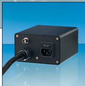
VISULEX Kamera K55-P mit Festobjektiv