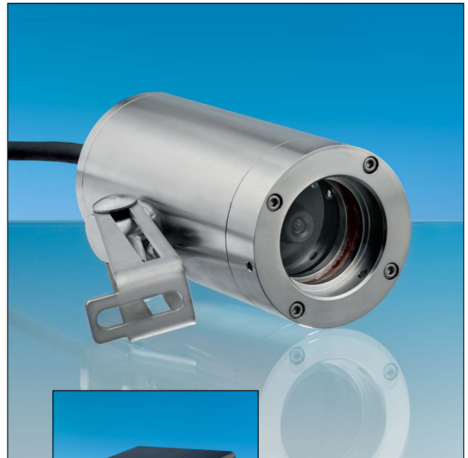
VISULEX Kamera K55P-Ex mit Festobjektiv