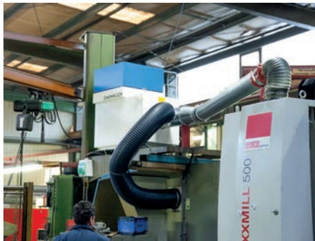
Luftreiniger mit Anbindung von zwei CNC-Fräszentren