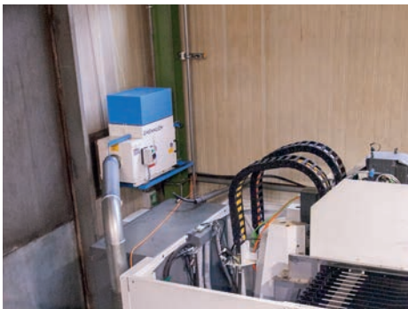
Luftreiniger bei DEINHAMMER

Anhand der Anwendungssituation wurde eine Ölnebelabsaugung mit einer Leistung von 2.700 m 3 /Stunde angeboten. Ein 5-stufiger Reinigungsprozess sorgt für eine leistungsstarke Absaugung und erfüllt überdies die DIN EN1822. Für die erste Absauganlage für DEINHAMMER wurde sogar ein Rückgaberecht mit Geld-zurück-Garantie vereinbart. Wohl wissend, dass der Kunde diese niemals in Anspruch nehmen würde. Denn als wir den ersten Reiniger an einer EMCO-Anlage montiert hatten, passierte, was zu erwarten war: Die Luft in und um die Maschine verbesserte sich augenblicklich. Der Emulsionsnebel beim Öffnen der Maschine war verschwunden.