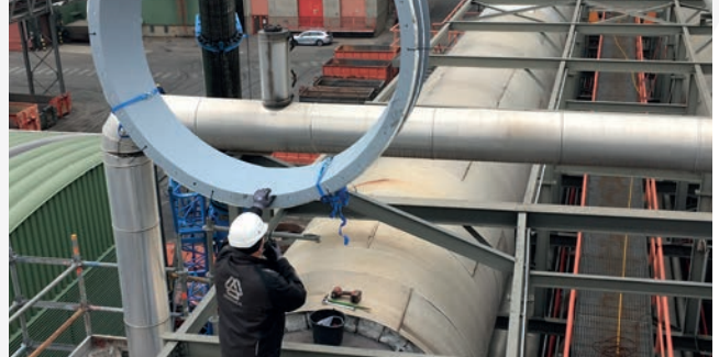
Montage von Kompensator und Leitblech mittels Autokran

Um die Arbeiten durchzuführen, wurde die Verbrennungslinie, in der die Maßnahmen stattfanden, vorübergehend stillgelegt. Das HENNLICH-Team hatte jeweils 14 aufeinanderfolgende Kalendertage für Linie 1 und Linie 2 zur Verfügung, um das Projekt abzuschließen. Allerdings konnten die Arbeiten in Linie 1 innerhalb von nur 8 Kalendertagen, einschließlich eines Samstags, erledigt werden, während Linie 2 nach 7 Tagen abgeschlossen war.