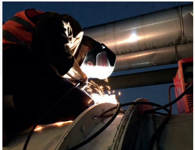
Dichtschweißen der Rohrleitung

Durch die Implementierung von Längenbegrenzern konnten übermäßige Ausdehnung der Rohrleitung verhindert und Druckbelastungen beschränkt werden.