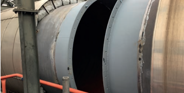
Anheften und Ausrichten der neuen Flansche

Weiters wurden Längenbegrenzer implementiert, um sicherzustellen, dass die Bewegungen der Kompensatoren innerhalb eines bestimmten Bereichs begrenzt sind und eine Beschädigung durch zu starke Dehnung verhindert wird.