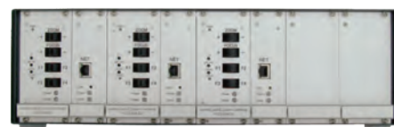
6fach Kamera-Rack mit drei Kamera-Einschüben und drei Videoservern bestückt