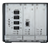
1fach Kamera-Rack mit Videoservert