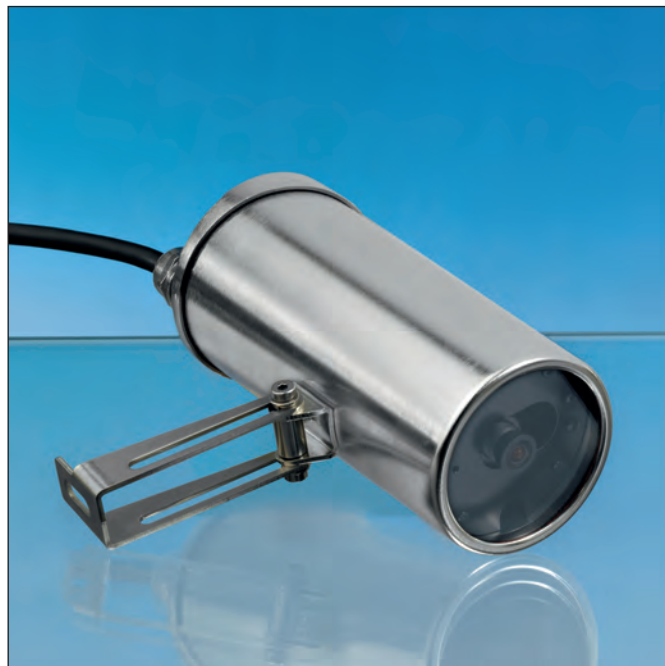
VISULEX Kamera K15ZP-E mit Zoom-Objektiv